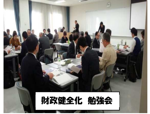
財政健全化 勉強会

滋賀県大津市の全国市町村国際文化研修所。 全国、北海道から沖縄まで 129 名の議員が参加しています。埼玉県からは私と他市の人1名。 資料の多さもありますが、矢継ぎ早の説明に必死について行って、あっという間です。