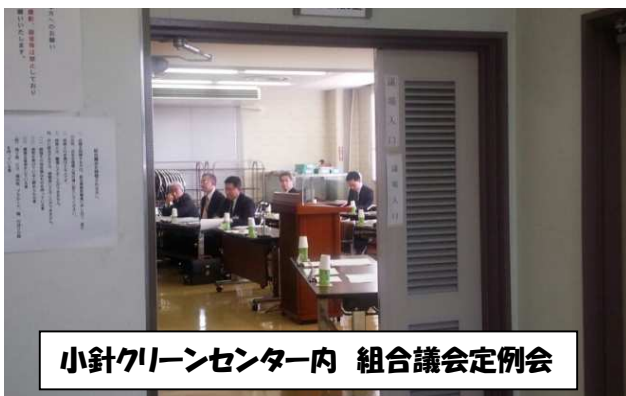
小針クリーンセンター内 組合議会定例会