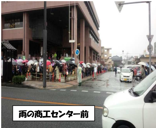
雨の商工センター前