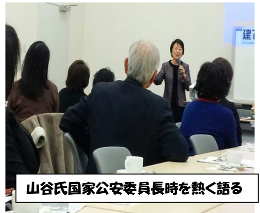
山谷氏国家公安委員長時を熱く語る

おかげで沖縄県民 46 歳平均寿命だったのが今は 83 歳の日本一の長寿県となった。