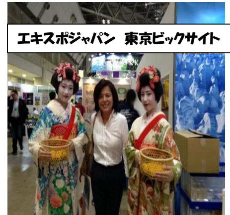
エキスポジャパン 東京ビックサイト

地方自治体間の競争が激しくなっている。それに勝っていかなければならない。桶川、東松山、滑川、越生などは国から交付金をもらっている。日本国中の沢山の自治体が交付金申請をもらっている。申請には大変な作業を伴うものではない。次回の新型交付金は受けるつもりがあるのか？北本市は交付金でアンテナショップを東京に出店する。行田市も全力で頑張りたい。