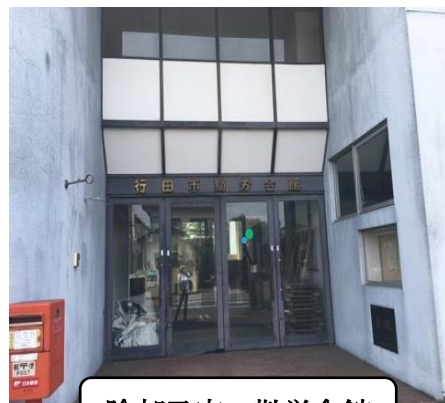
除却予定の勤労会館

先日発表された「行田市公共施設マネジメント計画」ではハコモノ(公共建築物)の量が行田市は多すぎる。県内で2番目の多さです！人口減少が原因です。今後、これらを維持し続ければ、その費用は1,000億円以上かかることとなります。その分、住民サービス等にしわ寄せがくると予想します。私は、議会で「不採算建物の削減を進め、今後むやみにハコモノを作るのはやめるべき。あるものを上手に利用していくべき」とたどしました。