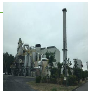
小針クリーンセンター